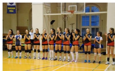
Drużyna kadetek MOS Wola Warszawa

Początek meczu zapowiadał się bardzo dobrze dla naszej drużyny, szybko objęliśmy prowadzenie, a po skutecznym bloku Uszyńskiej i Filińskiej na tablicy wyników widniał rezultat 4:2. Błąd w polu serwisowym zawodniczek MOS –u oraz skuteczny blok przeciwniczek ze Sparty doprowadziły do remisu 4:4. Błędy w przyjęciu oraz w ataku kadetek z Woli spowodowały, że na prowadzenie wyszła drużyna Sparty. Przy wyniku 7:10 trener Jacek Banasik poprosił o czas, niestety dopiero druga przerwa przy stanie 8:14 przyniosła oczekiwane rezultaty i nasze zawodniczki zaczęły odrabiać starty. Tym razem przy wyniku 14:17 o przerwę poprosił trener gości. Dobrą grą oraz skutecznymi atakami nasze zawodniczki doprowadziły do remisu po 17. Po chwili dwa błędy kadetek MOS Wola spowodowały, że na dwupunktowe prowadzenie wyszła drużyna gości. Skuteczny atak Uszyńskiej oraz punktowy blok na środku Sakowskiej spowodowały, że na tablicy wyników pojawił się remis 20:20. Następnie dobrą zagrywką popisała się Uszyńska i przy stanie 21:20 trener gości poprosił o drugi czas. Po przerwie skutecznym atakiem ze środka kolejny punkt zdobyła Sakowska, a atak z lewego skrzydła Niedźwieckiej