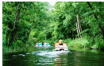
Spływ rzeką Sapiną w czasie ubiegłorocznych wakacji