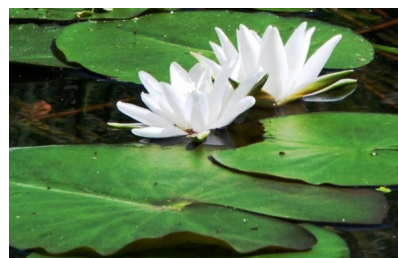
A więc nastał czas wakacji

Obóz sportowy w Rajgrodzie w terminie 3 – 13 sierpnia 2014 r.