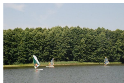
Na deskach serfingowych