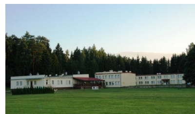
Ośrodek w Stręgielku na Mazurach.