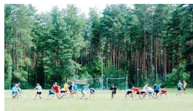
Trening na świeżym powietrzu