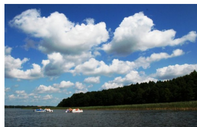
Na jeziorze Stręgiel